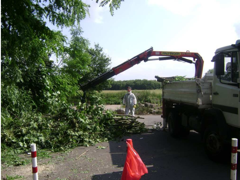
Fällung eines erkrankten Baumes; Stadt Köln

Erreger der Rußrindenkrankheit des Ahorns: Cryptostroma corticale