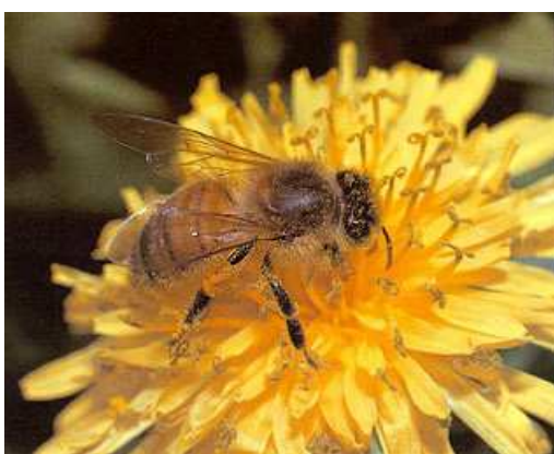
Im Frühjahr sind Bienen auf Frühblüher angewiesen, um Pollen und Nektar zu sammeln. Ab 10 °C Lufttemperatur und zusätzlicher Einstrahlung fliegen Bienen aus.

In ihrer Funktion als Bestäuber und Honigproduzenten gehören die Bienen zu den weltweit bedeutendsten Nutzinsekten. Zur Vermeidung von schädlichen Auswirkungen auf die Tiergesundheit beschränkt die Bienen-schutzverordnung das Ausbringen bienengefährdender Pflanzenschutzmittel auf die flugfreie Zeit. Eine opti-male zeitliche Einplanung chemischer Mitteleinsätze in den landwirtschaftlichen Betriebsablauf setzt daher eine Vorhersage des Bienenfluges voraus. Aus ihr können nicht nur Landwirte, sondern auch Imker Nutzen ziehen.